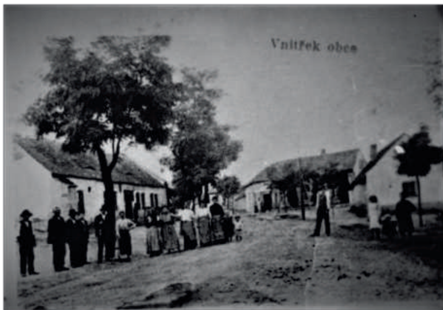
Náves - hostinec U Syneckých vlevo - naproti vázní domek v pozadí obchod žida Felixe.