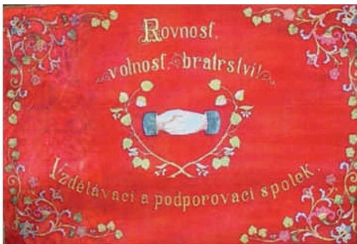
V hostinci u Čadských se scházel spolek Havlíček – Rovnost - Občanská Beseda (Havlíček) prapory zmizely údajně jsou v muzeum, v Rostkách