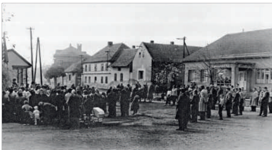
Hospoda u Čadských a Syneckých po přestavbě vedle statek u Viktorínů